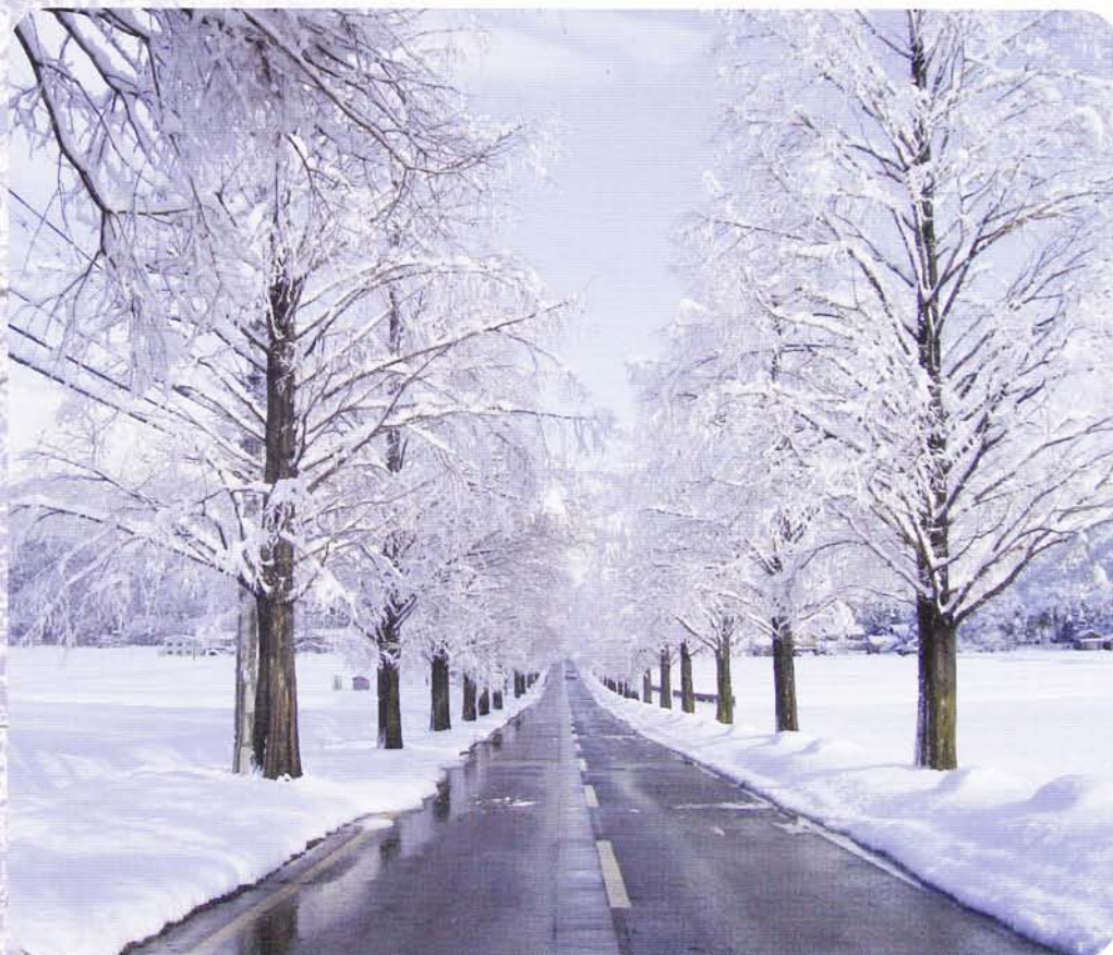
メタセコイヤ並木

発行/滋賀県看護連盟 発行責任者/赤沼フサ枝 〒524-0037 滋賀県守山市梅田町2-1 セルバ守山101 TEL.077-514-1331 メールアドレス shiga-kangorenmei@extra.ocn.ne.jp